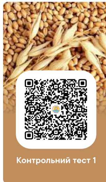
Рис. 3. Приклад QR-коду з посиланням на сервіс Google Форми для контрольного тестування з дисципліни «Борошномельно-круп'яне виробництво»

2. Контрольно-тестовий матеріал для навчальних занять, виконаний у вигляді карток з різними варіантами завдань, може бути представлений у формі QR-кодів.