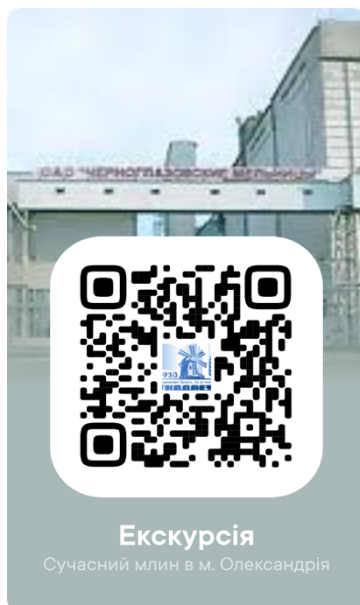
Рис. 7. Приклад віртуальної екскурсії на сучасний млин ТОВ «Зернарі» швейцарської фірми «Vuhler» в Олександрії Кіровоградської області

Використання QR-коду при вивченні спецдисциплін дозволяє включати великий обсяг даних, характеризується простотою в читанні та скануванні, дозволяє моментально переводити інформацію в електронний вигляд, виконувати необхідні завдання. Створення QR-коду є загальнодоступним: в інтернеті є велика кількість програм, що дозволяють закодувати будь-який текст. У відповідних полях необхідно ввести потрібну інформацію, натиснути кнопку «створити код», після чого у цьому полі з'явиться відповідний QR-код. Отриманий результат може бути збережений як зображення або як постійне посилання на нього і згодом розміщений в будь-якому необхідному місці.