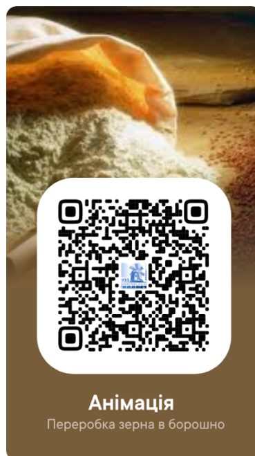
Рис. 6. Приклад закодованої 3D візуалізації технологічного процесу виробництва борошна

5. У сторінки підручника можна вклеювати (вставляти/прикріплювати) QR-коди з посиланнями на сайти з зображеннями обладнання, характеристика та опис якого наведено в тексті підручника, відеофрагментами його роботи, анімаційними роликами тощо.