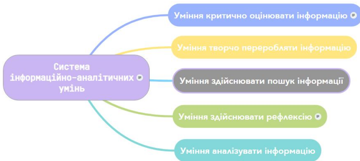
Рис. 1. Система інформаційно-аналітичних умінь

З'ясувавши питання формування інформаційно-аналітичної компетентності фахівців окремих галузей нами запропоновано універсальну систему інформаційно-аналітичних вмінь майбутніх науково-педагогічних працівників, яка представлена на рис. 1.