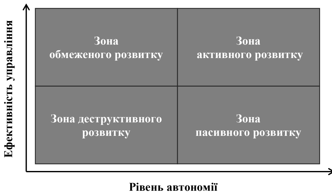
Рис. 1.3. Матриця стратегічного вибору