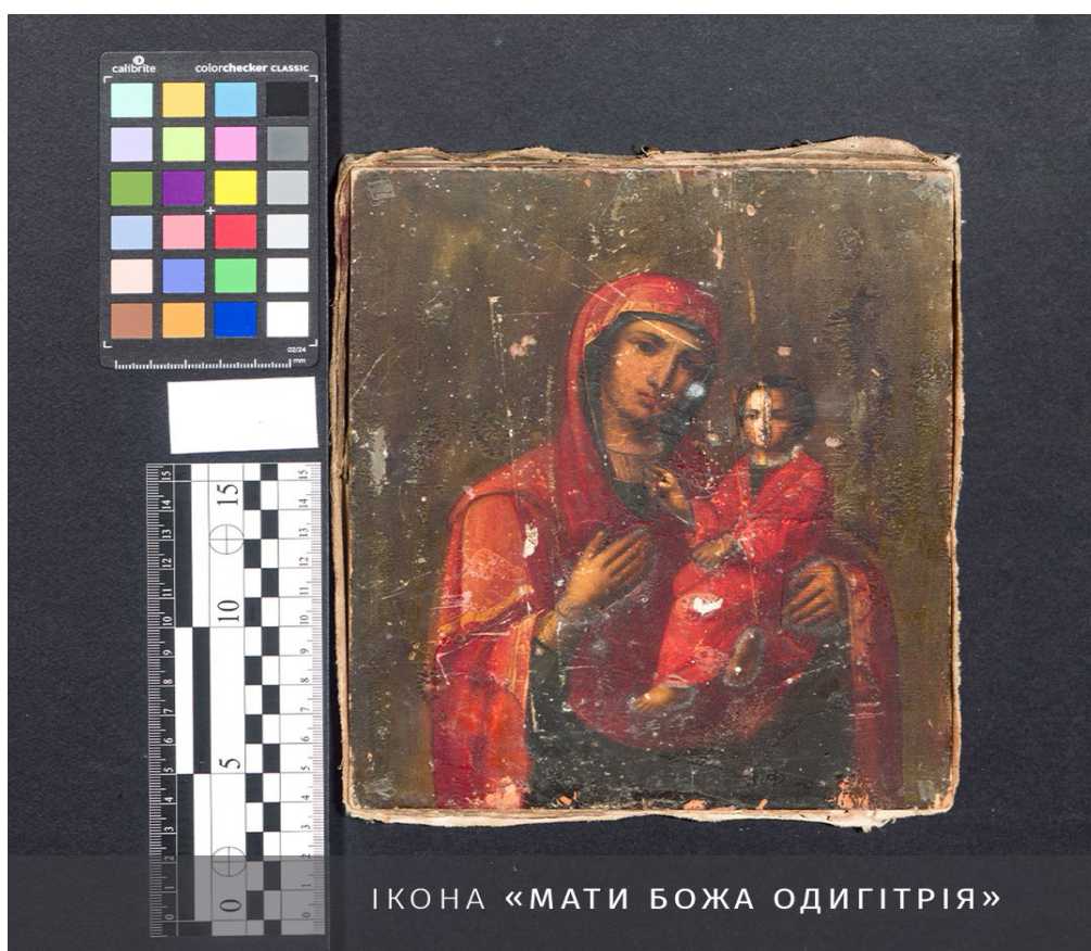
Рис. 2. Ікона «Мати Божа Одигітрія»