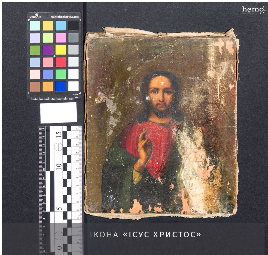
Рис. 1. Ікона «Ісус Христос»