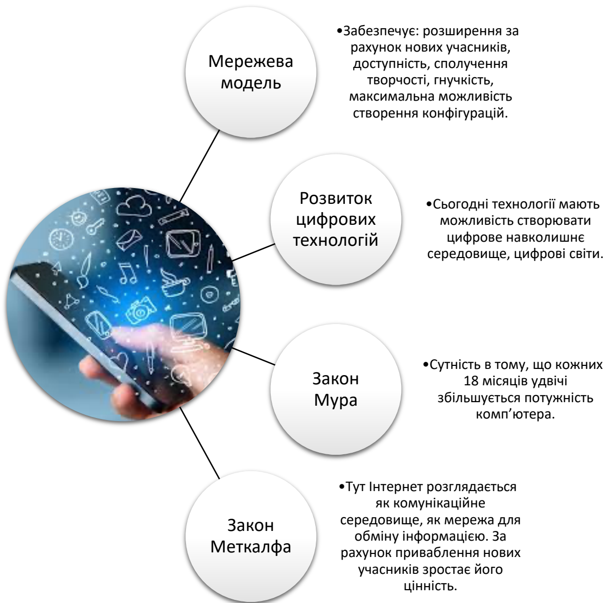
Рис. 1. Основні причини використання інтернету в економіці та повсякденному житті суспільства

В сучасних умовах світових тенденцій щодо «переведення» своєї бізнес-діяльності в безмежні простори Інтернету, постають нові можливості та фактори впливу на діяльність підприємства та його розвиток. Тому якщо раніше Інтернет застосовувався як один із можливих інструментів маркетингу, то зараз він постає ключовим середовищем, яке потребує все більше досліджень та визнання його важливості у розробленні стратегічних та маркетингових планів.